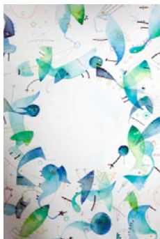
Ole Ukena, Ocean Armada I , 2010, Series of 2 drawings, watercolor, pastel, ink, marker on hand-made paper, each piece 65 x 100 cm, courtesy artiste