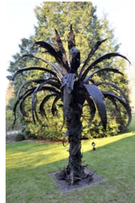
Douglas White, Black Palm , 2010, 350 x 350 x 350 cm, pneus assemblés, Collection privée Bruxelles, Courtesy Laurence Dreyfus