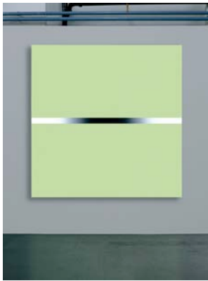
Pierre Schwerzmann, Sans titre , 2010, 180 x 180 cm, Courtesy Gérald Friedli