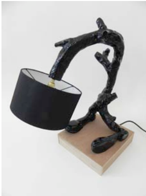
Barry Reigate, Lamp 1 , 2010, 60 x 27 cm, unique, Collection privée Bruxelles, Courtesy Paradise Row Gallery