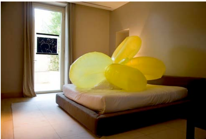
Jeff Koons, Chambres à part II, 2008