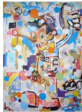
Barry Reigate, Divine Moments of Unmanliness , 2008, 210 x 156 cm, Courtesy Paradise Row Gallery