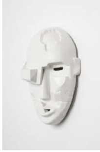
Fabian Marti, Datura , 2010, 33 x 20 x 11 cm, unique