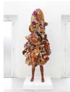
Nick Cave, Soundsuit , 2010, 232 x 70 x 11 cm, Collants, sacs vintage