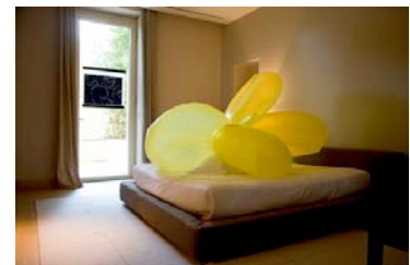
Jeff Koons