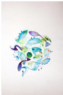
Ole Ukena, Ocean Armada II , 2010, Series of 2 drawings, watercolor, pastel, ink, marker on hand-made paper, each piece 65 x 100 cm