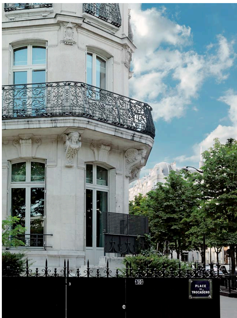
La Réserve - Paris