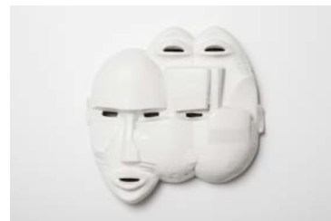
Fabian Marti, AlphaMethylTryptamine , 2010, 39 x 40 x 11 cm, unique, Courtesy artiste